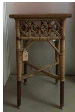
Guéridon pour plante début 20 ème

La récupération des carreaux anciens a permis une intéressante réfection des sols de la brasserie et du vestibule.